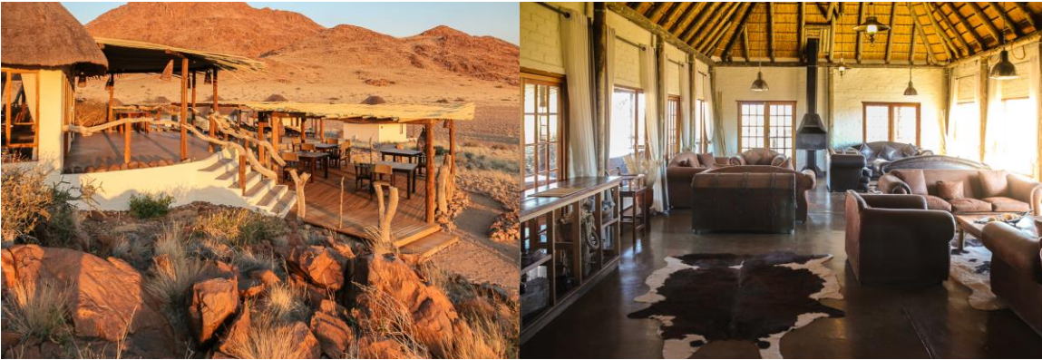
Desert Homestead Lodge (Dinner, Zimmer mit Frühstück, Sundowner Drive, Sossusvlei-Ausflug)

Die Chalets sind in stilsicherer Einfachheit gehalten, die Küche verwöhnt mit frischem Farmhausgerichten, und der Pool gewährt zur Hitze des Tages willkommene Abkühlung. Je nach Sonnenstand variiert das Farbspiel des Tageslichts und taucht die raue Landschaft in behagliche Pastelltöne.