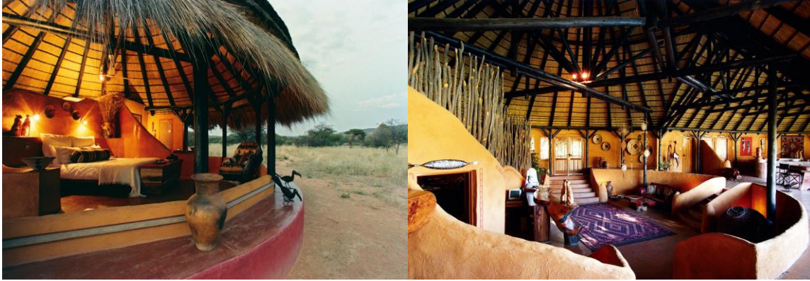
Okonjima Bush Camp (Vollpension + Aktivitäten)

Nach dem Lunch und einer kurzen Siesta beginnen im Winter um 15 Uhr, im Sommer um 16 Uhr die Aktivitäten. Hierzu gehören die Rundfahrt über das Raubkatzen-Rehabilitations-Zentrum, Spurensuche nach Geparden und Leoparden, Vogelbeobachtung sowie eine Wanderung zur Vergangenheit der Buschmänner, in deren Verlauf Sie viel über das Leben der einstigen Jäger und Sammler im gesamten südlichen Afrika erfahren.