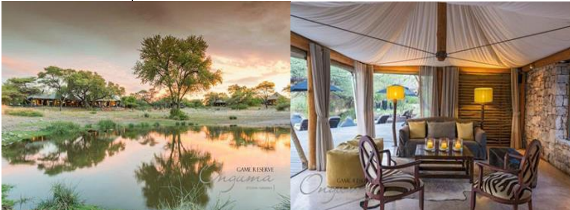
Mittagessen sowie alle Aktivitäten der Lodge und der Eintritt in den Etoscha Nationalpark auf eigene Rechnung

Die wunderschön gestaltete Lounge wird aus mehreren ineinanderübergehenden Zeltgewölben gebildet und birgt Rezeption, Restaurantdeck, einen kleinen Pool und die Bar. Zahlreiche Sitzgruppen laden zum Verweilen ein und bieten immer wieder den freien Blick auf die nur 60 Meter entfernte Wasserstelle, an der sich das Wild ein Stelldichein gibt. Neben den täglichen Safariaktivitäten vom Geländewagen aus genießen Sie die entspannte Atmosphäre in diesem bildhübschen Zeltcamp.