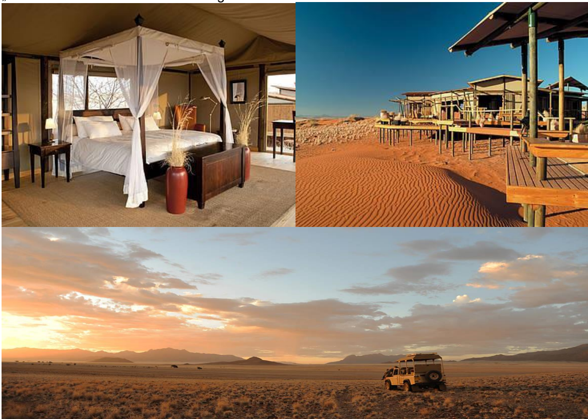
Wolwedans Dunes Lodge (Vollpension + Aktivitäten)

Während der Tage auf Wolwedans können Sie sich gar nicht satt sehen an den faszinierenden Landschaften, die Sie während der Panoramafahrten mit dem offenen Geländewagen passieren. Das fragile Gleichgewicht der Wüste wird Ihnen von dem kompetenten Guide erklärt. Weiche Formen der Sandlandschaften wechseln ab mit rauen Felsformationen. Die Sonne tut ihr übriges, um ständig wechselnde visuelle Eindrücke einzufangen. Immer wieder wundert man sich, wie unter den Bedingungen des Wüstenklimas all die Tiere, die Ihren Weg kreuzen, überleben. Auch überrascht es, in dieser Landschaft zahlreiche Zeugnisse früherer Besiedlung durch Buschmänner zu entdecken. Auf Wunsch werden die Fahrten auf Wolwedans auch als Ganztagesexkursionen gestaltet, während der zu gegebener Zeit an markanten Stellen wie dem ‚Hard Rock Kaffee‘ ein Picknick eingenommen wird.